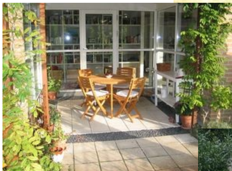
Et godt eksempel på et haverum, der er budt indenfor...