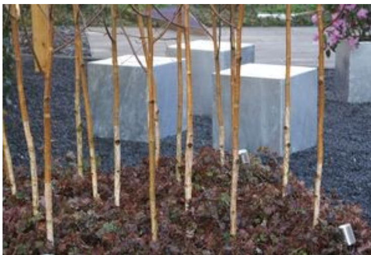
Læg mærke til at der ikke er sparet på træerne og at de om natten er oplyst nedefra...