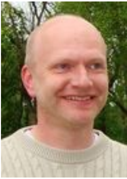
Jens Peter Jacobsen